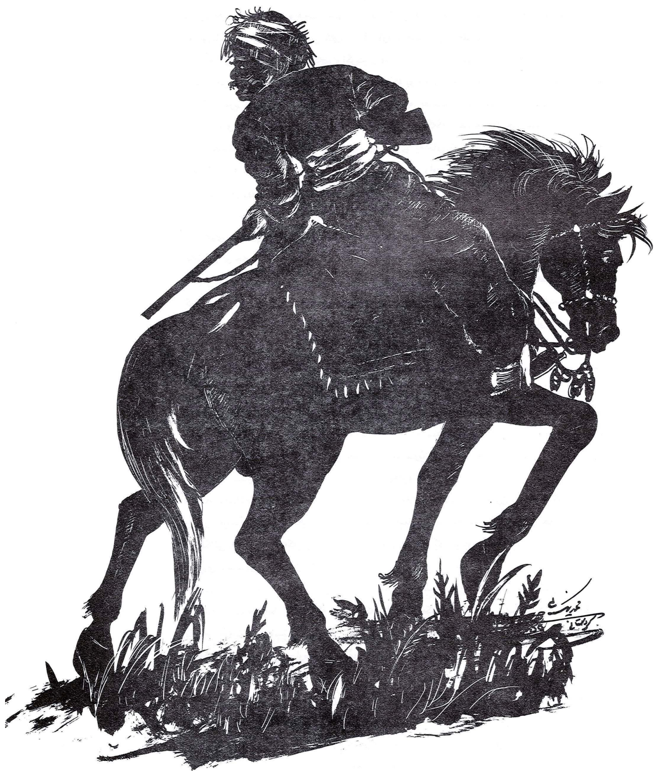
نیگار: محمدهدی نیکپوی. سنه - کوردستان.